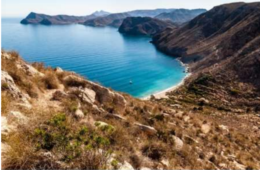
Bajada La Rellana (Cala San Pedro). Km. 8