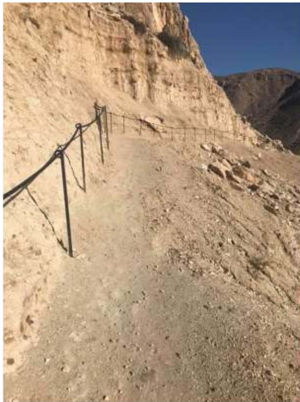
Cala San Pedro Salida. Km. 9